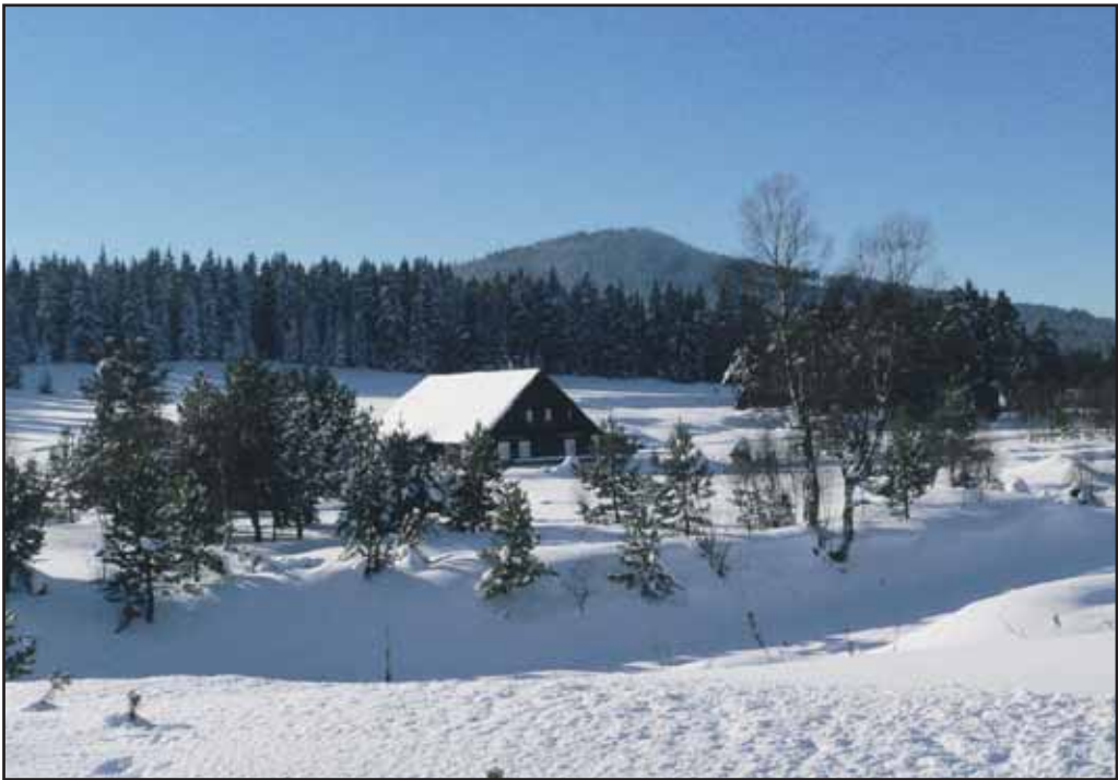
Die sonnendurchflutete Winterlandschaft entlang des Hammerbaches bietet mit dem Antigel im Hintergrund dem Skiwanderer eine großartige Naturkulisse

(Hartmanitz) verfügt über ein neues Loipenspurgerät, so dass auch dort der Langlaufrer nicht zu kurz kommt. Für die Winterwanderer bietet der Sumava leider immer nur noch zu geringe Möglichkeiten zum richtigen Wandern auf geräumten, verkehrsberuhigten Winterwanderwegen. Einige kann man inzwischen aufzählen, z. B. die beiden oben erwähnten Wegeabschnitte ab dem Grenzübergang Bucina nach Kvilda bzw. ab Grenzübergang Haidmühle nach Stozec, immerhin bleibt dies hier keine Zukunftsvision mehr. Über die Zugänglichkeit und den Loipenzustand sowie das Angebot informieren neben den Nationalpark-Infostellen genauso im Vorjahr das kostenlos verfügbare „Quartett“-Faltblatt „Weiße Spur“ bzw. das Internet unter: www.bilastopa.cz oder www.npsumava.cz .