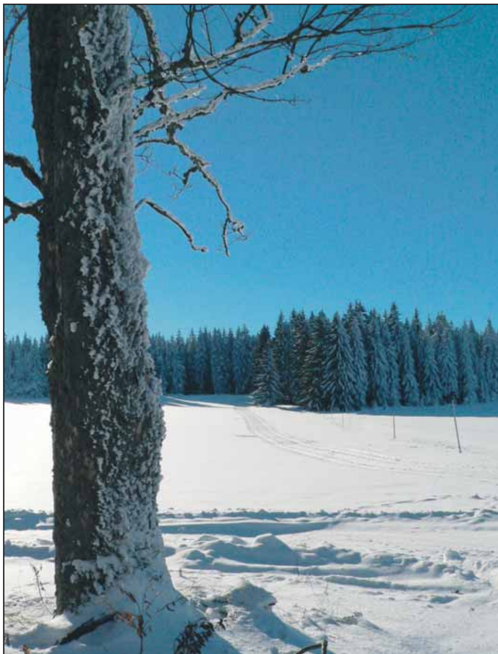
„Freie Spur“ und weißen Naturgenuss im Nationalpark Šumava!

Erst vor ein paar Tagen wurde im Grenzbahnhof Bayerisch